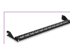
1U 48 Puertos, Manejo de Cable Trasero