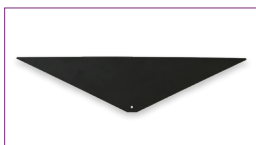
Cubierta de Panel Angulado