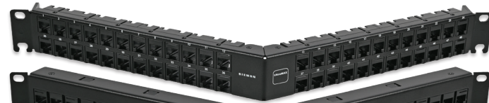
1U, 48 Puertos, Panel Angulado