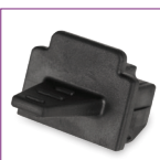
Tapa de Puerto