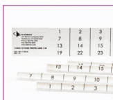
Hojas de Etiquetas