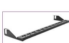
1U 24 Puertos, 2U 48 Puertos, Manejo de Cable Trasero