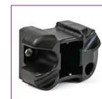
Inserto par Protector de Mano